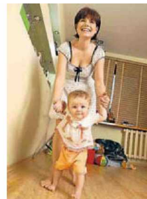
Cada cop hi ha més mares al voltant de la quarantena.

Es viu com una pèrdua i s’ha d’elaborar un dol per la pèrdua del fill biològic que no s’ha pogut tenir. I cada dona necessita el seu temps.